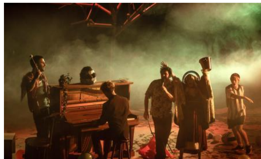
Le collectif Greta Koetz installera son « Jardin » dans la cour de la Maison Folie.

Pour son grand retour après deux annulations, le Festival au Carré voyage dans toute la ville de Mons et aux alentours, au Manège mais aussi dans les jardins et sur les places publiques. Avec une ambition : vous faire vivre des expériences singulières.