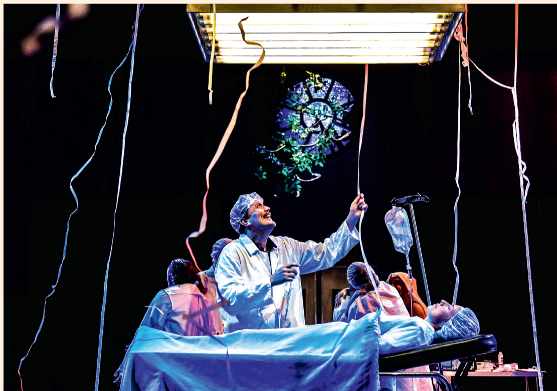
Le spectacle «La vie est une fête» a pour décor un hôpital psychiatrique. Ce n'est pas rien d'avoir choisi ce lieu où l'on soigne pour dire ce qui nous abîme.

Toutes les minorités en prennent pour leur grade avec un degré de violence verbale tellement élevé qu'il fait franchement rire.