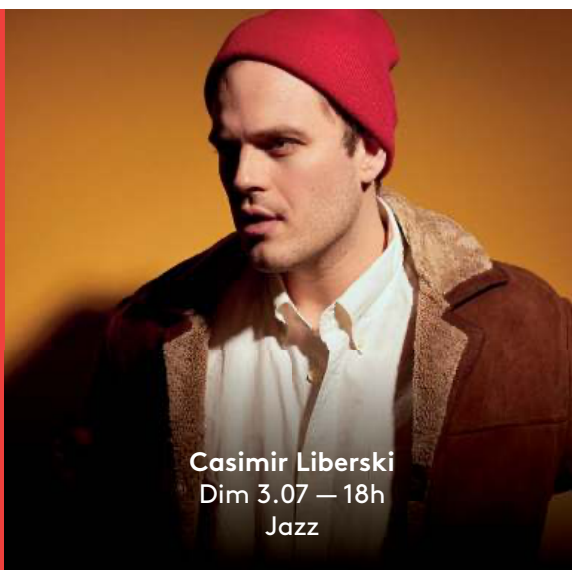
Casimir Liberski Dim 3.07 — 18h Jazz

© Alexander Popelier / Roymaud de Lage / Juliet, Benoît / Audrey Morta