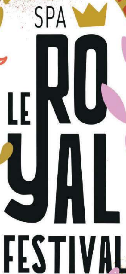
Illustration : Jo Delannoy - jocessineuppey

10 > 21 août THÉÂTRE • CIRQUE MUSIQUE • HUMOUR royalfestival.be