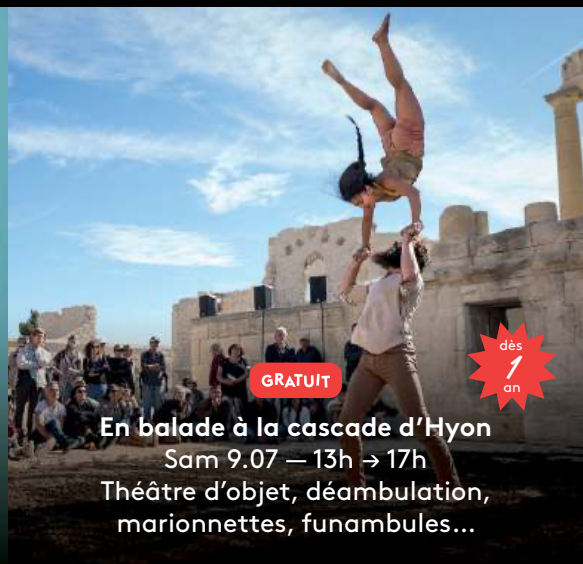
En balade à la cascade d'Hyon Sam 9.07 — 13h → 17h Théâtre d'objet, déambulation, marionnettes, funambules...