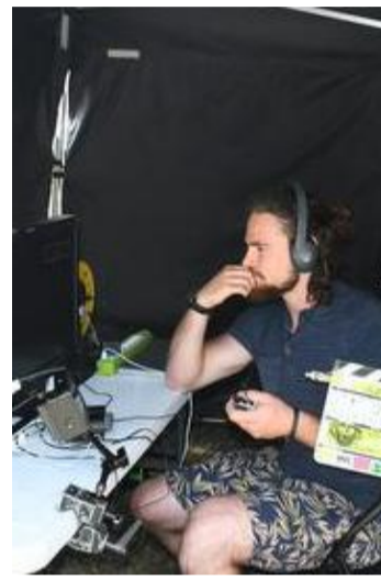
Sur le tournage.

À Saint-Ghislain, on trouve pas moins de vingt techniciens pour l'encadrement de ce tournage. En allant sur place, on n'imaginerait pas que tant de