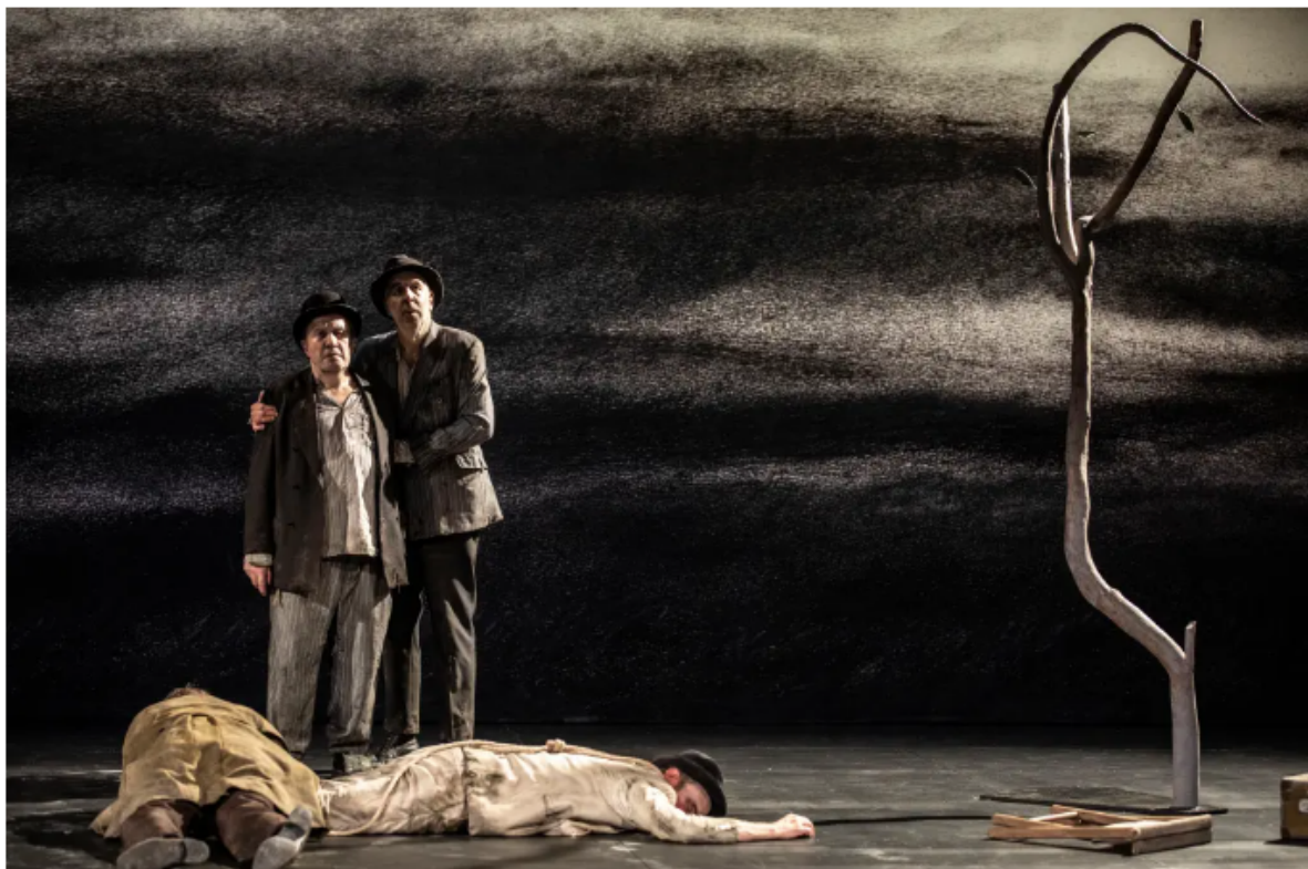
En attendant Godot mis en scène par Alain Françon

Réflexions sur une misère héritée des traumatismes de la Seconde Guerre mondiale, la pièce témoigne d'une Europe de la désolation et d'un monde impossible à reconstruire en conscience après le point de non-retour dans l'horreur que représente Auschwitz. Alain Françon fait entendre cette plainte à travers un humour pince-sans-rire qui se réclame d'abord de l'élégance du désespoir. À l'heure où L'Europe est à nouveau devenue un territoire de destruction et de guerre , les réflexions de Beckett se révèlent d'une actualité bouleversante.