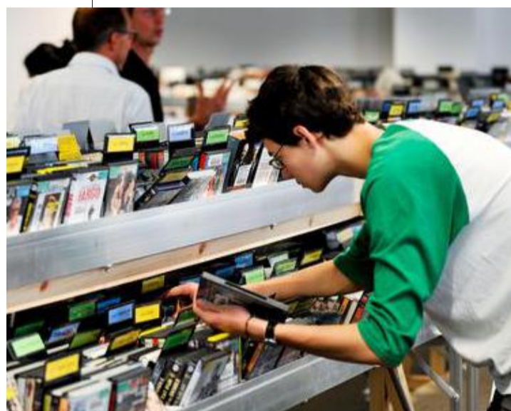
La collection et les ressources de PointCulture sont visiblement sauvées. © PIERRE-YVES THIENPONT.

Bref, ne dites plus « discothèque nationale » ni « médiathèque », dites plutôt : « Je retourne à la bibliothèque », en étant conscient de la révolution qui anime depuis des années ses rayonnages.