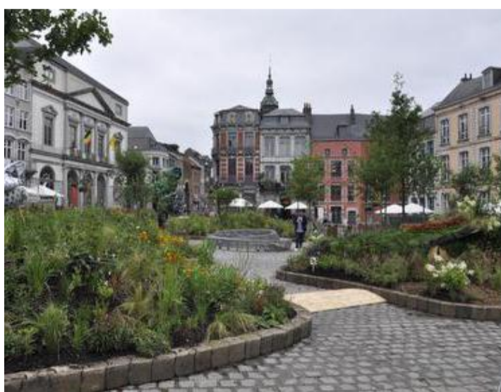
Les jardins éphémères sont de retour à Mons.

Des balades sportives à vélo sont prévues les dimanches 31 juillet et 28 août. Une manière de découvrir la région de Mons à coups de pédales ! Chaque dimanche de juillet et août, les amateurs de salsa, bachata, kizomba ou toute autre danse latine se donneront rendez-vous sur la Grand'Place, au cœur des jardins éphémères pour danser