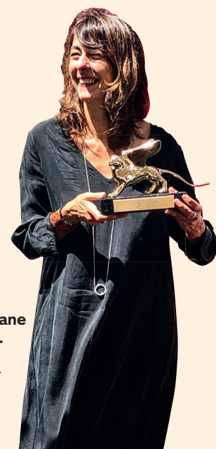
Christiane Jatahy.