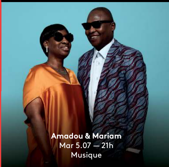
Amadou & Mariam Mar 5.07 — 21h Musique