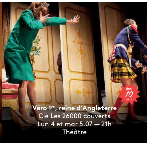
Véro 1 re , reine d'Angleterre Cie Les 26000 couverts Lun 4 et mar 5.07 — 21h Théâtre