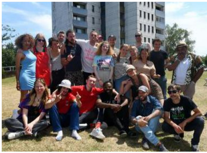
L'équipe de tournage à la cité des Aubépines.

La coopérative montoise « Big Trouble in Little Belgium », qui produit la série, travaille de façon horizontale comme nous