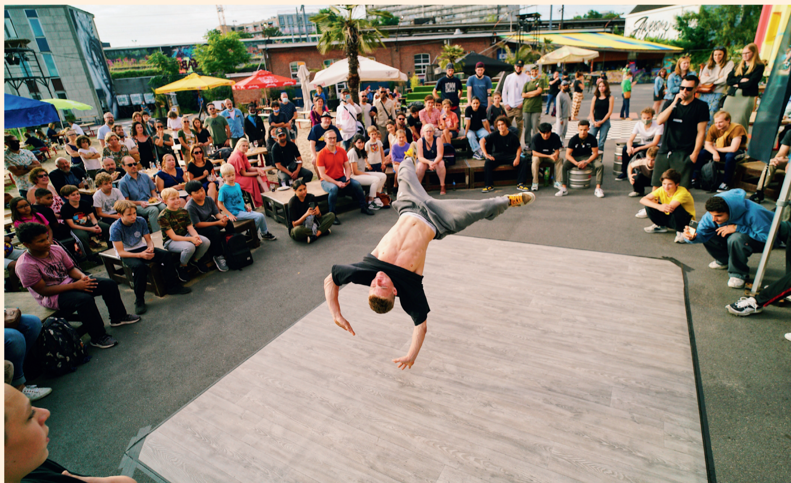
Au Zomer van Antwerpen, séance de breakdance par la Zomerfabriek... Fun!