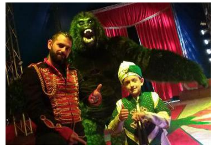
Avec King-Kong.

Si vous souhaitez (re)découvrir le cirque Braytony, vous pouvez tenter votre chance à notre concours. Pour cela, rien de plus simple, il suffit de nous envoyer un mail à laprovince@sudinfo.be . Précisez bien « concours cirque » en objet et n'oubliez pas d'indiquer votre commune et votre numéro de téléphone. Vous avez jusqu'à ce dimanche 26 juin, 12 h pour participer. Il y aura 9 gagnants. Ils remporteront chacun deux places, pour la représentation de leur choix. Les gagnants seront tirés au sort parmi les mails reçus et seront prévenus personnellement par mail. ■