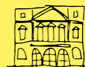
Théâtre Royal Grand Place