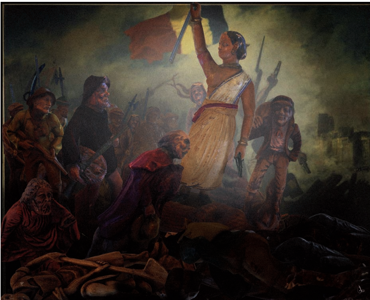
La Liberté guidant le peuple d'Eugène Delacroix (1830)

NB : vous pouvez retrouver l'ensemble de ces visuels sur notre site internet