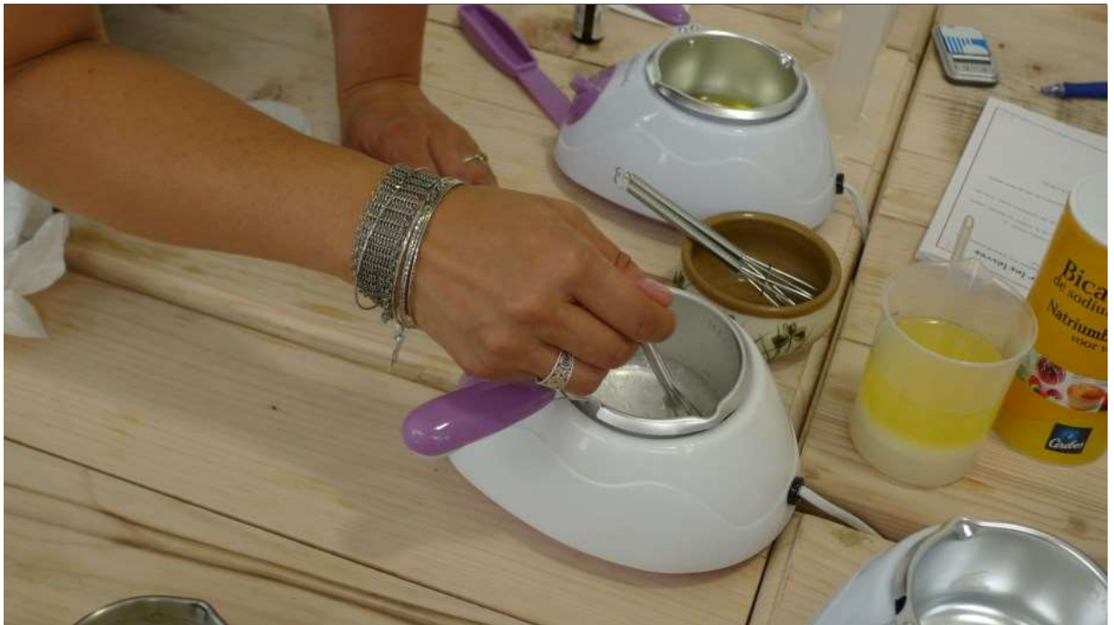
Différents ateliers animeront l'eco-festival "Demain, Mons-Borinage". Comme celui de fabrication de cosmétiques Hedwige Leclerc